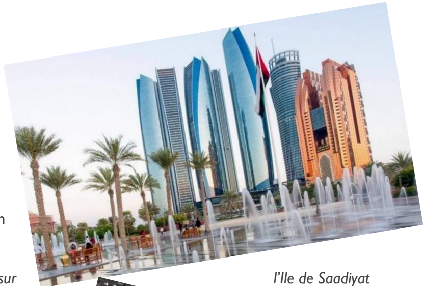
l'île de Saadiyat

Construit sur l'île de Saadiyat (l'île du bonheur), une île naturelle de 27 km 2 (l'équivalent d'un tiers de la surface de Paris), le District Culturel sera un quartier composé d'établissements culturels de renom : le musée universel du Louvre Abu Dhabi, dont le projet architectural est conçu par Jean Nouvel, le Cheikh Zayed National Museum, dessiné par Norman Foster, et le musée du Guggenheim Abu Dhabi, imaginé par Frank Gehry.